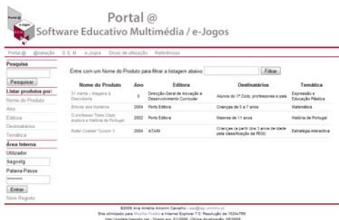
Figura 1 – Sistema de Pesquisa (área pública)

Vale ressaltar que, as avaliações serão realizadas principalmente por professores e outros profissionais que utilizem os SEM ou e-jogos de forma educativa. Para tanto, foi necessária a criação de duas áreas para o site, área pública, figura 1, e área restrita.